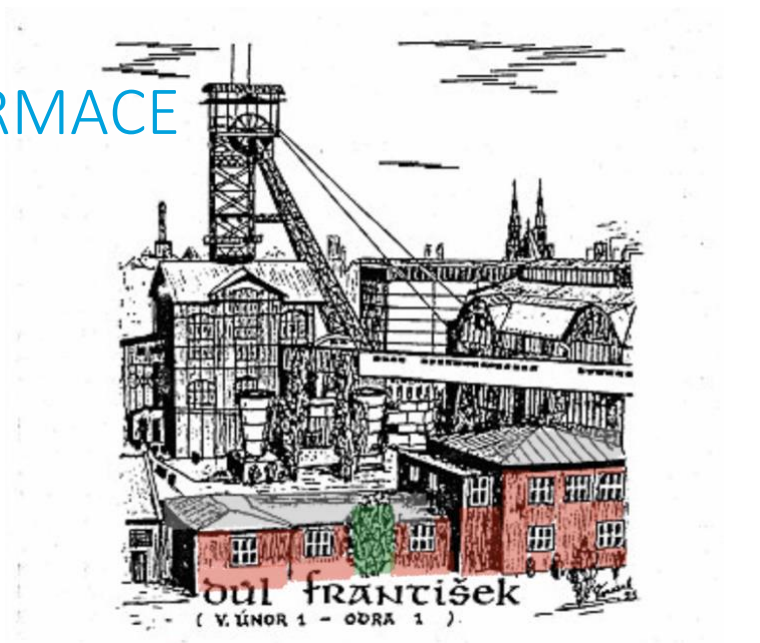
Sídlo společnosti kresba Stanislava Vopáska

Veškeré dokumenty a materiály uvedené v této výroční zprávě a podklady použité ke zpracování výroční zprávy jsou uloženy s sídlo společnosti na adrese Koksárni 7/18, 702 00 Ostrava.